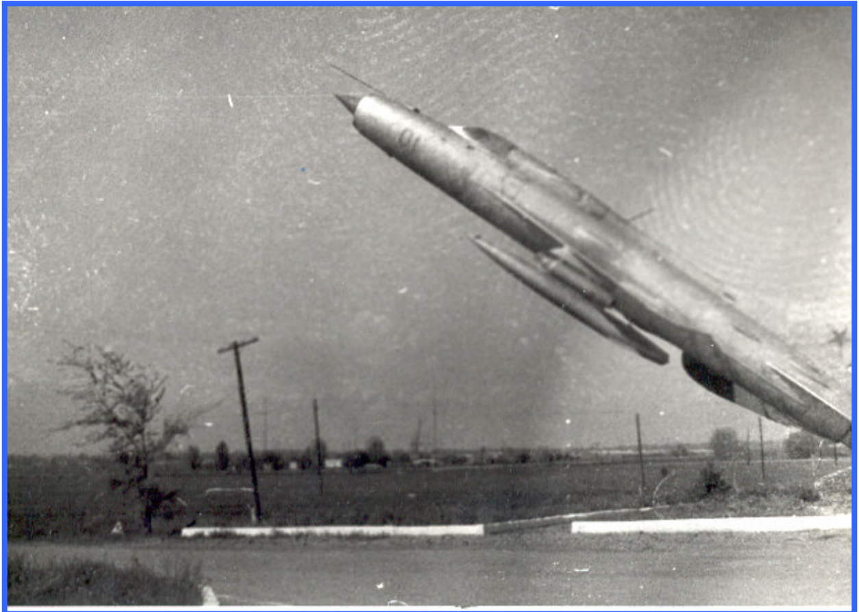
Před vchodem do kasáren