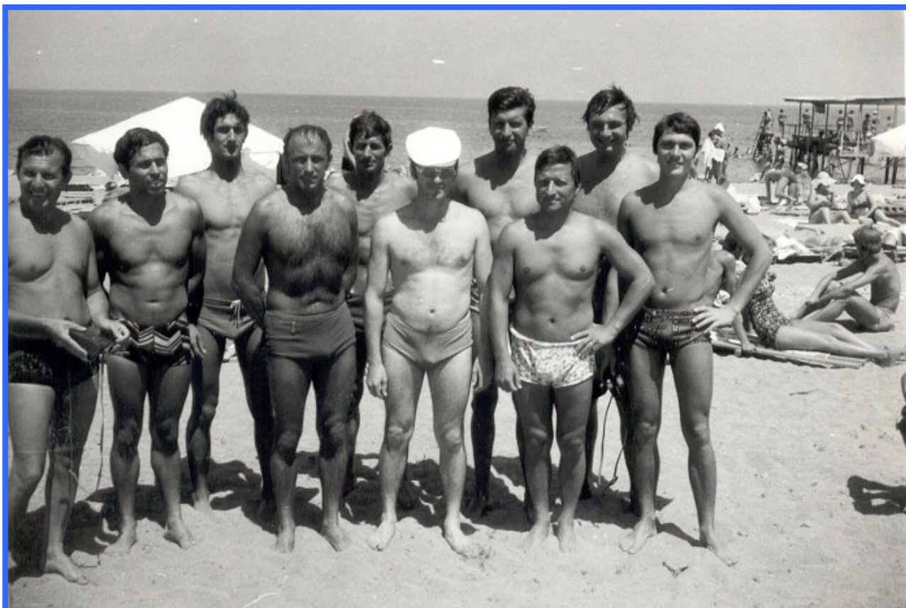
Na pláži Issyk Kulu

Na pláži jezera jsme vydrželi až do pozdního odpoledne. Mezitím jsem ve vojenských lázních poobědvali a okusili přírodní radioaktivní léčivou minerálku. Pak jsme odjeli na letiště ve vesnici Tamga, nastoupili do Il-14 a letěli zpět do Frunze. Osádku jsme přemlouvali, aby vymysleli nějakou závalu a vrátili se. Ani to nebylo třeba. Při letu přes Převalského průsmyk jsme se dostali do zhoršeného počasí a letoun se doopravdy vrátil zpět. Poletíme domů do Frunze až na druhý den! Večer byl náš. Tamga to je pro příslušníky zdejší letecké divize jako Jeseníky pro naše piloty. Tráví zde preventivní rehabilitace. Večer jsme tedy s posádkou Il-14 vyrazili na taneček. Poznali jsme zase nové přátele, bylo to hezké. Na druhý den ráno 30. června byla bouřka, už jsme si mysleli, že zde prožijeme další den. Ale než jsme se nasnídali, počasí se umoudřilo a my jsme pěšky šli na letiště Tamga. Il-14 odstartoval z tohoto prašného letiště a za ním zůstaly jen mraky rozvířeného prachu a naše vzpomínky. V 11.00 jsme byli opět ve Frunze.