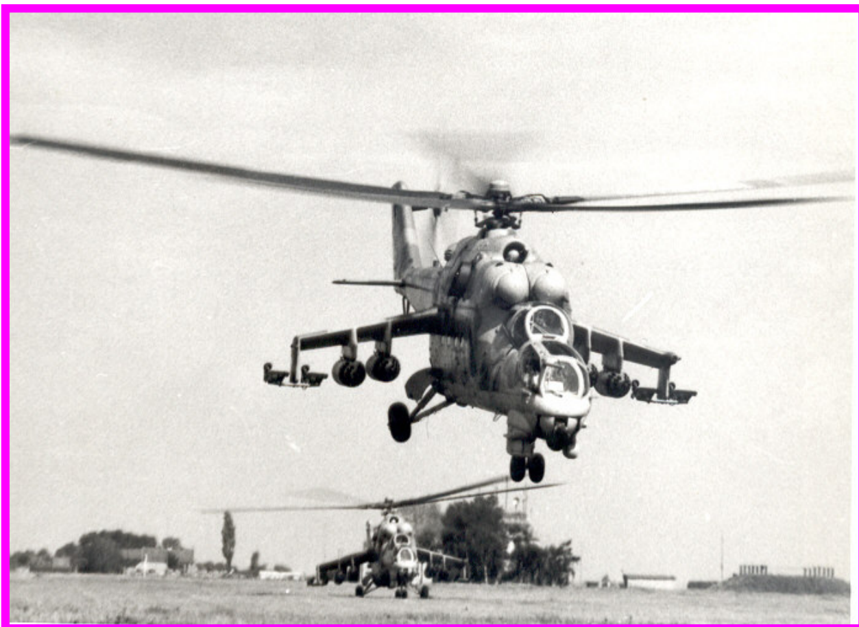
Mi-24D čl. vojenského letectva na prvním cvičení v roce 1979