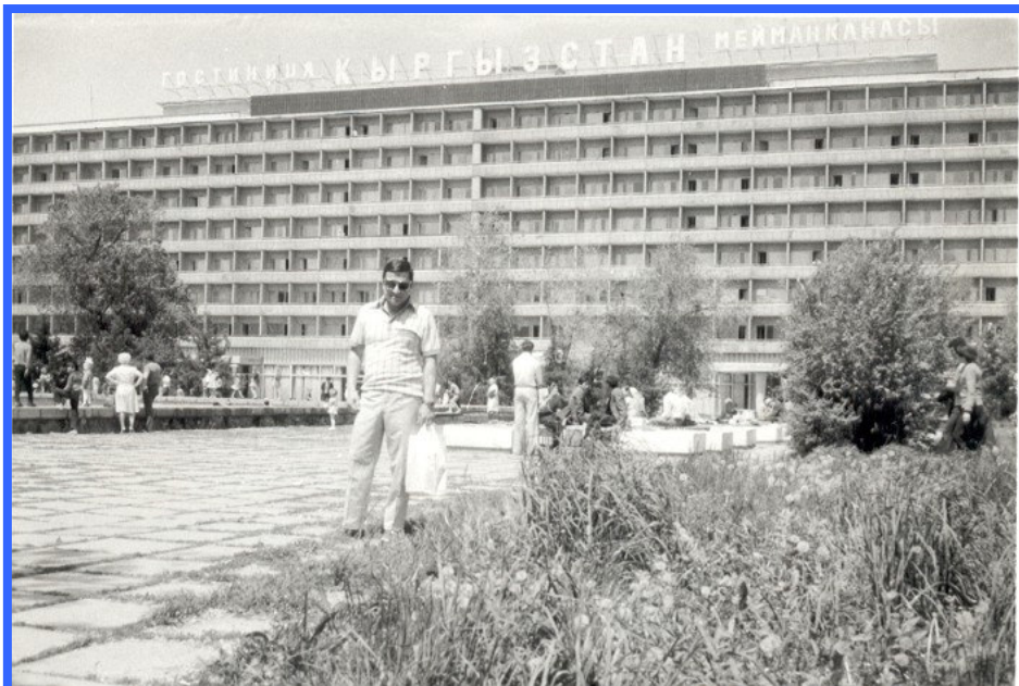
Autor u hotelu Kyrgyzstán

dobu jsem vykonával funkci velitele letky těchto bojových vrtulníků, inspektora vrtulníkového letectva a na závěr kariéry funkci zalétávacího pilota v Leteckých opravárnách. Z celkového počtu nalétaných 4500 hodin jsem v kokpitu těchto strojů strávil 1200 hodin bez jediné nehody, bez jediné problémy. Ale to již není součástí tohoto malého povídání o přeškolování, je to jiná kapitola života.