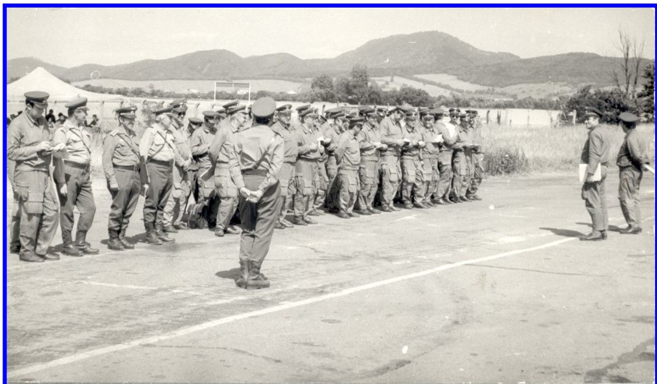
Předletová příprava 51.vrp na létání v Malackách, rok 1981